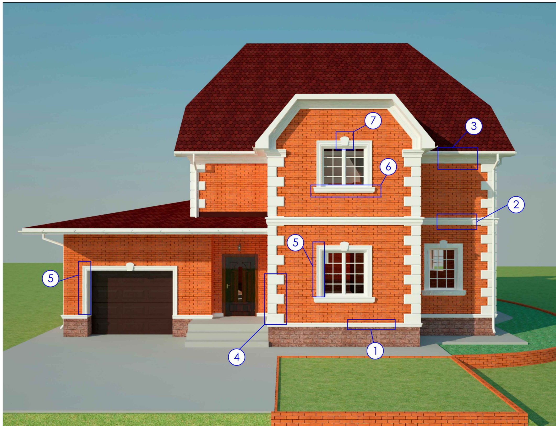
Спецификация декоративных элементов